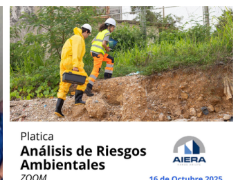
Platica Análisis de Riesgos Ambientales ZOOM